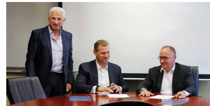
La firma del contrato sobre el nuevo acuerdo de colaboración se llevó a cabo en las instalaciones de BVS Industrie-Elektronik.

Desde 2015 somos la única empresa dentro del sector de accionamientos y controles que está autorizada como Punto de servicio técnico de Bosch Rexroth . Fue la primera vez a nivel mundial que se concedió esta distinción a una empresa del sector de la reparación de electrónica industrial.