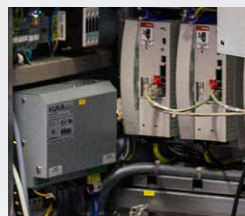
Regelungen, Umrichter/ Servoverstärker & Netzteile